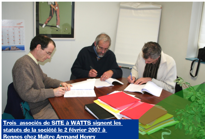
Trois associés de SITE à WATTS signent les statuts de la société le 2 février 2007 à Rennes chez Maître Armand Henry (avocat d'affaires).

Les futurs associés de la SARL pourront répartir leurs apports en capital et en comptes courants bloqués . En outre il sera appliqué un coefficient de revente du ou des